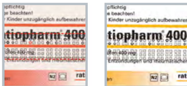
Beispiele einer Braille- (Blindenschrift-) Prüfung