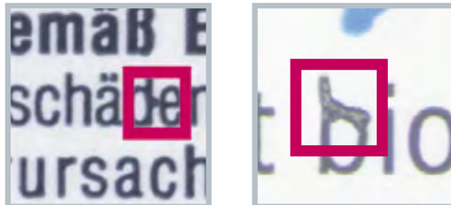
Beispiele von Druckfehlern bei Schriften

Ein wesentlicher Schritt der Faltschachtelprüfung ist die automatische Erkennung der Stanz- und Falzkanten, denn nur mit dieser Information lässt sich der Inhalt präzise prüfen. Die EyeC Stanzkantenerkennung ermöglicht diesen Schritt sicher und automatisch mit fast allen möglichen PDF-Eingangsformaten, beispielsweise im ECMA-Standard, mit Ebenen, Spotfarben oder als einfarbige Konturlinie. Neben der Prüfung des Textes und der Grafiken sind Barcode-Prüfung und Braille- (Blindenschrift-) Prüfung häufig notwendige Bestandteile der integrierten Qualitätsprüfung von Faltschachteln. Der EyeC Profiler ermöglicht alle diese Prüfungen in einem Arbeitsschritt.