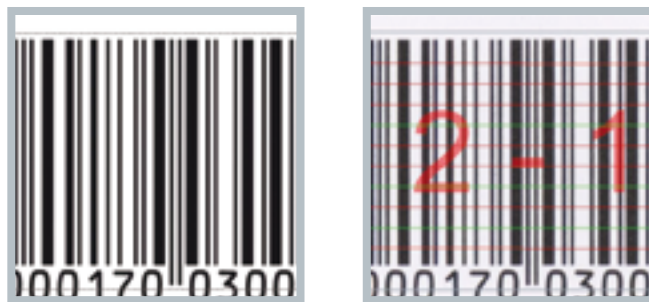
Beispiele einer Barcode-Prüfung