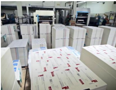
La sede de EMEGE IMPRESORES en Buenos Aires, Argentina.

EMEGE IMPRESORES es un fabricante de cajas plegables con sede en Buenos Aires, Argentina. Con 50 años de experiencia en la producción de cajas de cartón para la industria farmacéutica, la empresa se esfuerza por ofrecer la mejor calidad y eficiencia a sus clientes.